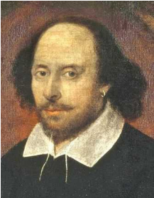
William Shakespeare englischer Dichter und Dramatiker geb. wahrscheinlich am 23. 4. 1564 in Stratford-on-Avon gest. 23. 4. 1616 in Stratford-on-Avon

Viola hat ein Schiffsunglück vor der Küste Illyriens überlebt, bei dem ihr Zwillingbruder Sebastian ums Leben gekommen zu sein scheint. Viola beschließt, als Mann verkleidet in die Dienste des Herzogs Orsino zu treten, der über Illyrien herrscht. Orsino ist unsterblich verliebt in die Gräfin Olivia, die aber aus Trauer um ihren verstorbenen Bruder die Gesellschaft von Männern meiden will. Die als Mann verkleidete Viola, die sich jetzt Cesario nennt, gewinnt rasch die Gunst Orsinos und wird von ihm beauftragt, seine Liebesbotschaften an Olivia zu übermitteln. Olivia verliebt sich jedoch in den „jungen Mann“ Cesario, während Cesario/Viola Gefallen am Herzog gewonnen hat.